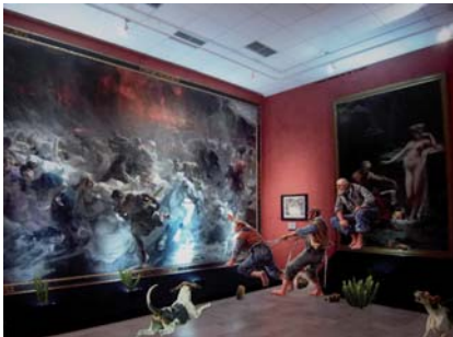
De un cuadro al otro

nos hicieron revivir, presenciar, protagonizar y reconocer los más diversos sucesos de la Historia que vive en nuestra memoria individual y colectiva.