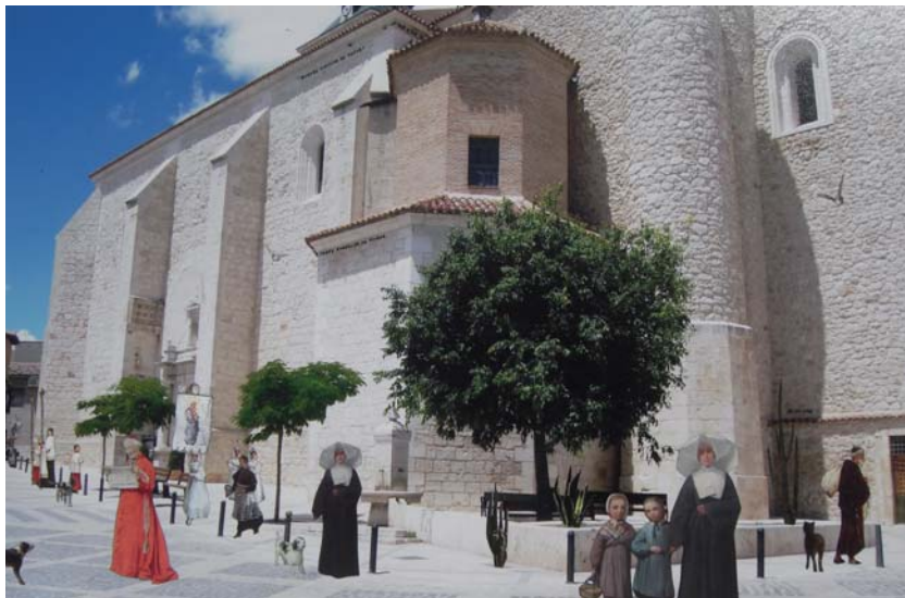
Buenas noticias de Checa