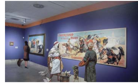
¡Qué época tan buena!